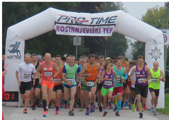
start 33. kostanjeviškega teka, september 2018

Proga je dolga 9 km. Start in cilj teka je pri Osnovni šoli Jožeta Gorjupa, Kostanjevica.